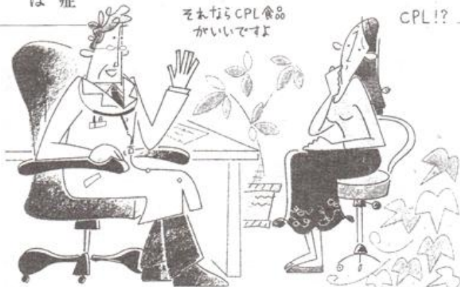
子宮内膜症や月経困難症が気になるなら、試してみる価値はある

月経血逆流の過多によって、周囲の腹膜や腸などが癒着を起こすと、痛みが生じたり、骨盤内がうっ血して頭痛や冷え症、吐き気などが起きたりなど、月経困難症や更年期の不快症状が現れるのです。東洋医学でいう「お血」と呼ばれるものによる症状です。