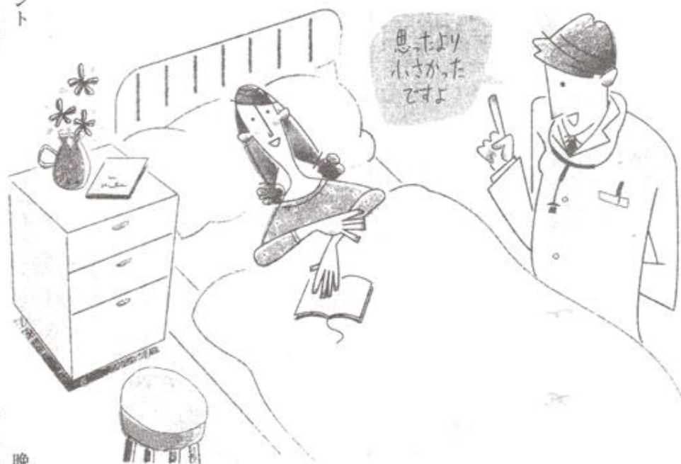
卵巣嚢腫が縮小しあっけないほど楽な手術で済んだ

晩取ることにしました。婦人科のほうでは漢方薬が桂枝茯苓丸 けいしりつりょうがん という薬に変わり、その漢方薬とCPL食品を、取り続けることにしたわけです。 婦人科の定期検診でもまったく問題なし CPL食品を取り始めて1カ月は