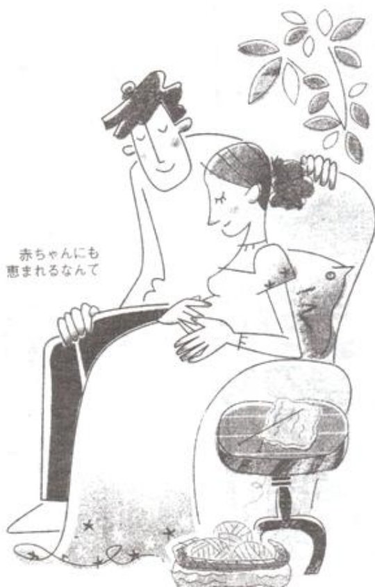
赤ちゃんにも 恵まれるなんて

「CPL食品」を利用し始めたのは、2年半ほど前からです。夫が職場でCPLのことを知り「生理痛の人にいらしいから、だまされたと思って毎日飲んでみたら」と勧めてくれ