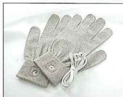
グローブセット(オプション) 6,000円(税別)