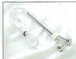
Vスティック(オプション) 19,800円(税別)